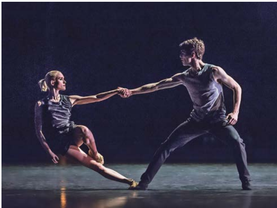
Balet NdB DANCE BRNO 100.

Ožijí také fotografie v projektu Příběhy fotek . Město jako pořadatel festivalu požádalo veřejnost, aby zaslala své fotografie s krátkými příběhy, které se k těmto snímkům vztahují. Díky nim organizátoři vytvoří mimořádný archiv osobních vzpomínek – historii plnou skutečných lidských příběhů. Fotografie budou provázet i festival.